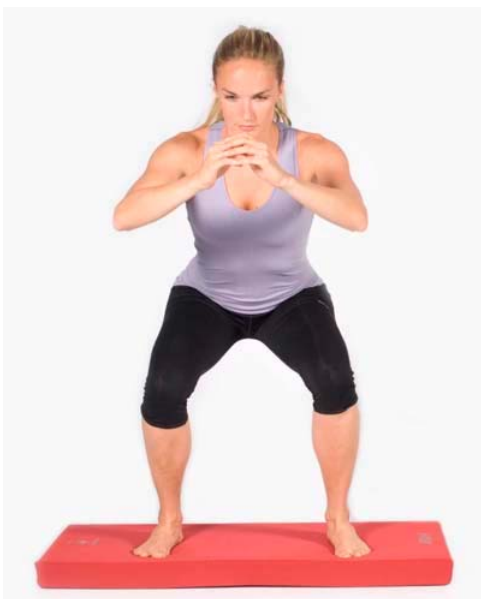
(© Kybun Marketing & Trading AG)

Mit dem kyBouncer gut vorbereitet in den Ski-Urlaub (22.01.2010/mh) Knie-, Oberschenkel- und Rumpferletzungen gehören zu den häufigsten Verletzungen im Ski-Sport. Mit einfachen Fitnessübungen können Freizeit-Ski-Fahrer schon vor Urlaubsantritt ihre Muskeln trainieren und so Unfällen vorbeugen.